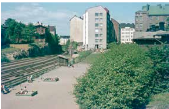
Helsinki, Malminkatu 5 ja Rautatiekatu 14 sekä 16. Varhaisessa valokuvassa tulee esille Satamaradan luonne kanta-kaupunkia ja esikaupunkia erottavana teollisena rakenteena. Kuvan etualan rakenteista ovat jäljellä enää tässä rakenteilla oleva Fredrikinkatu ja itse Satamaradan kalliioleikkaukset. Kuva Signe Brander 1907, Helsingin kaupunginmuseo.