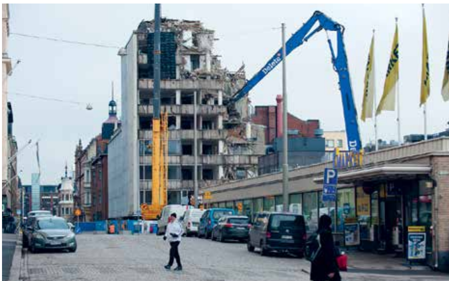
Hotelli Kämp, Theodor Höjjerin suunnittelema loistohotelli vuodelta 1887 purettiin ja rakennettiin osin kopiona 1960-luvun puolivälissä, tosin esimerkiksi kuuluisa Peilisali uudessa kuosissa ja uudessa paikassa. 1915.